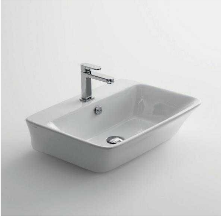
Lavabo Cow 60

Nel bagno secondario verranno installati sanitari in ceramica Artceram Serie Ten, e precisamente :