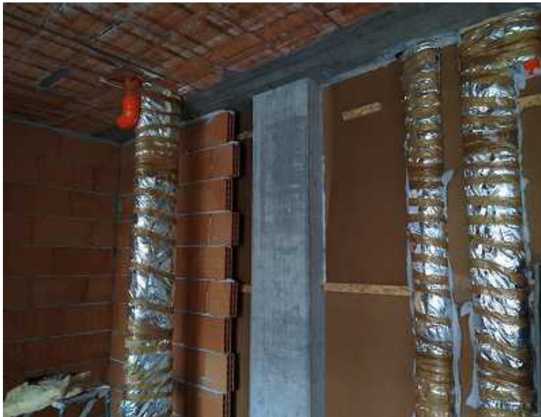
Muratura divisoria tra due appartamenti, da osservare l'isolante acustico.

Tutti i materiali adoperati nelle strutture e nelle rifiniture saranno di ottima qualità, scevri da difetti ed accuratamente posti in opera.