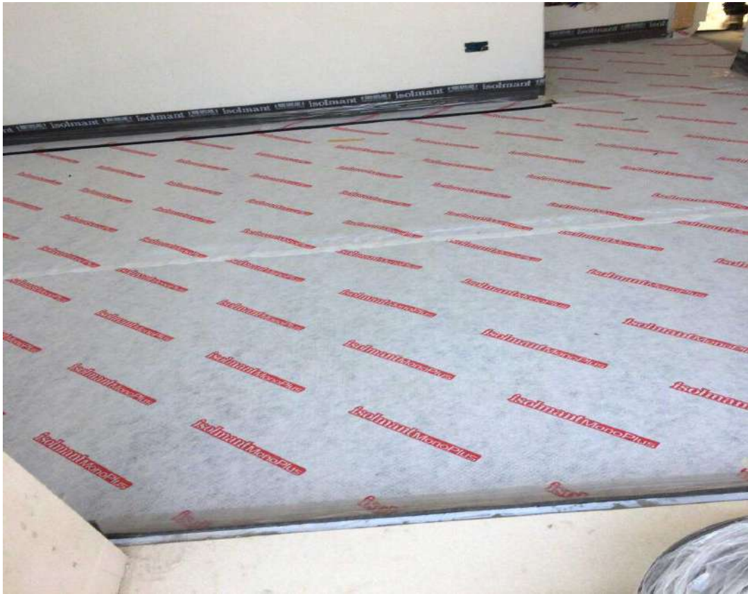
Tappeto acustico e fascia perimetrale prima della posa del riscaldamento a pavimento