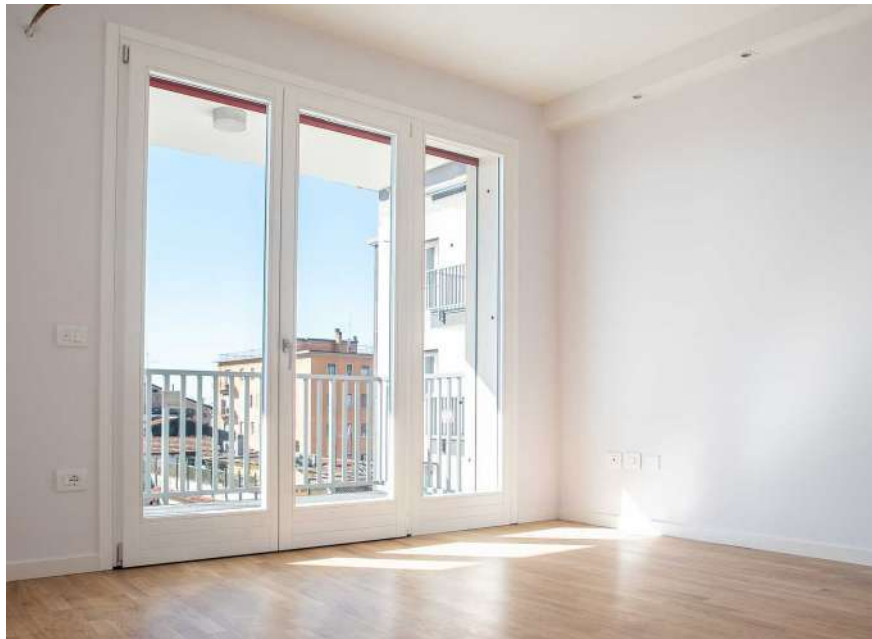
Serramento due ante apribili ed una parte fissa

Saranno forniti di anta a ribalta e sistema di microventilazione, ideato per far fuoriuscire l'umidità prodotta all'interno dell'appartamento.