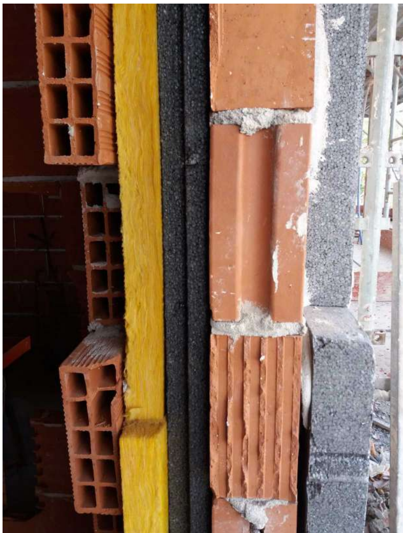
Muratura perimetrale esterna

Le pareti interne divisorie tra i locali delle stesse unità, saranno in laterizio forato dello spessore di cm 8.