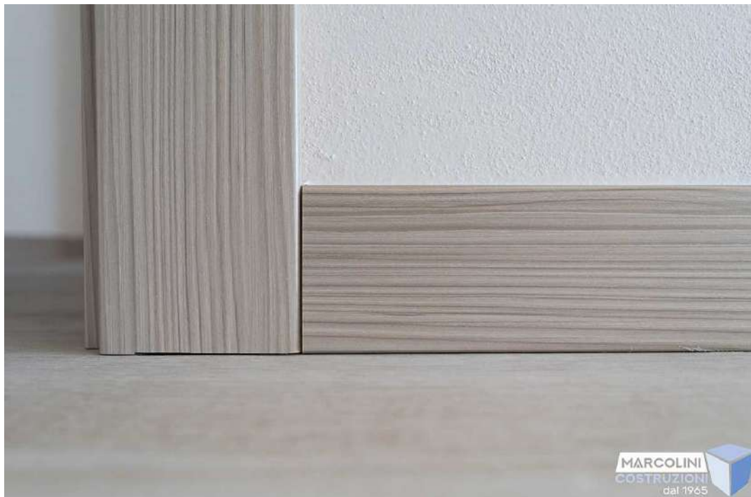
Pavimentazione e battiscopa

I pavimenti di tutti i locali saranno in gres porcellanato con posa diritta o diagonale e fuga da 2 mm. con un prezzo di fornitura e posa non superiore a Euro 32,00 il mq oltre iva.