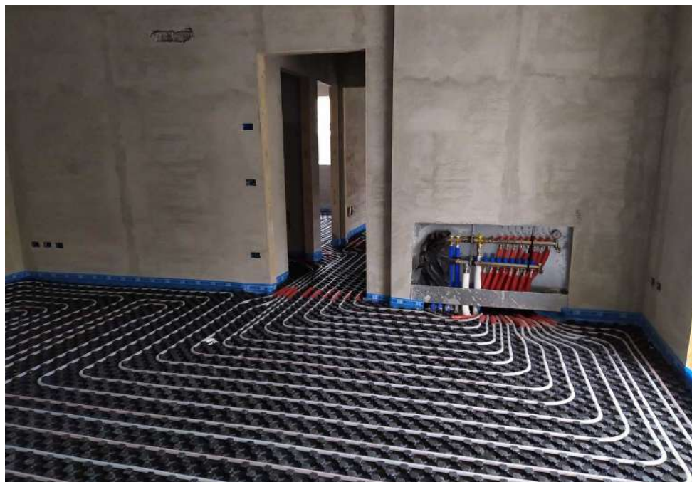
Riscaldamento a pavimento completo

Tale impianto sarà atto a garantire una temperatura interna di + 20°C in tutti i locali e + 22°C nei bagni, con temperatura esterna di - 5°C. Questo tipo di impianto risulta largamente al di sopra dei limiti di Legge richiesti per le fonti energetiche rinnovabili, per l'acqua calda sanitaria (50%), riscaldamento, raffrescamento e ACS (35% totale.)