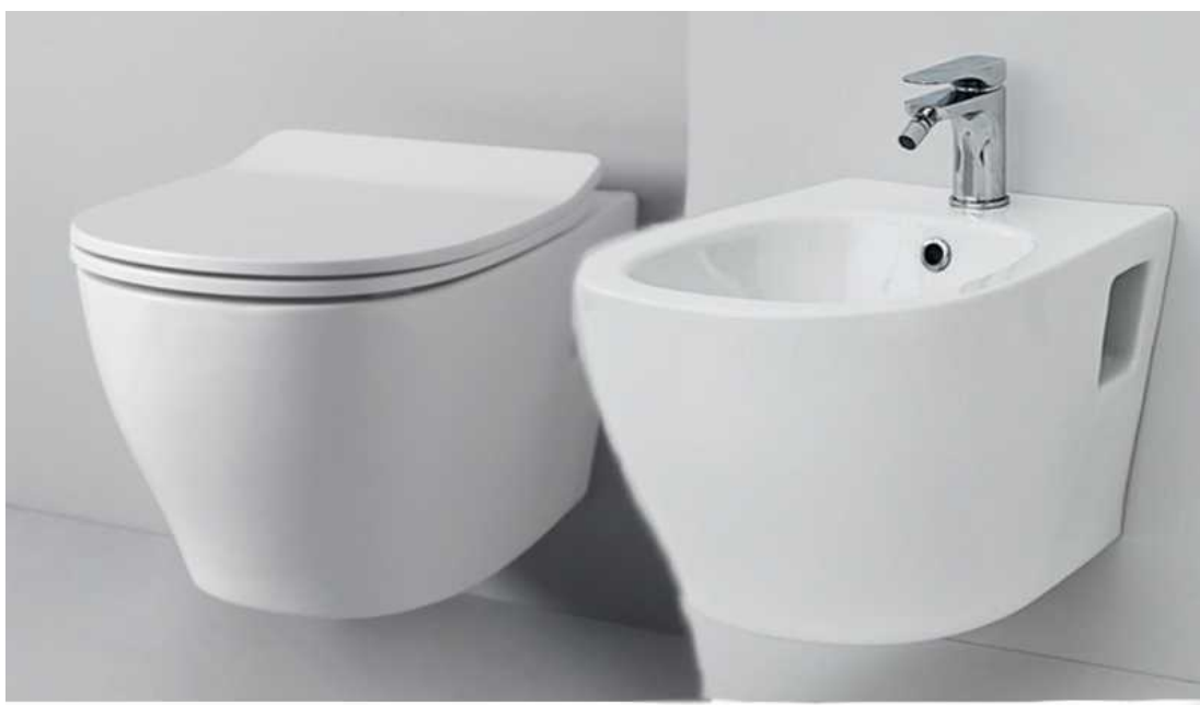
Sanitari Ten Sospesi